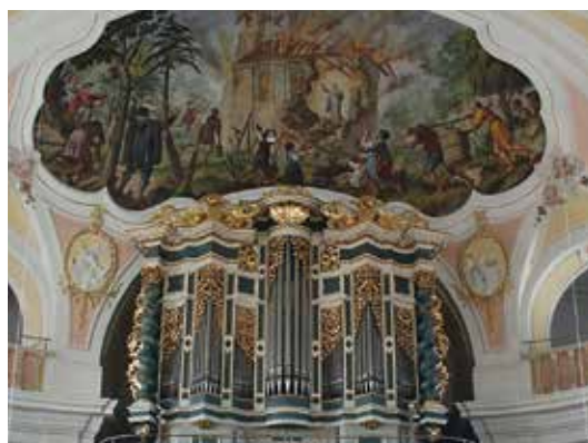
Zeigt die wunderbare Rettung des Salvatorbildes beim Kirchenbrand von 1329: das Fresko über der Orgel.

Die Prozession lockt mit ihrer besonderen Aussagekraft alle zwei Jahre hunderte beeindruckte Besucher an. Dabei werden lebensgroße, geschnitzte Holzfiguren von 200 Trägern, für die zentnerschweren Figuren sind Trägerschaften von sechs bis 16 Mann erforderlich, zu pastoraler Musik durch den Ort getragen. Die Mitwirkenden sind sowohl katholisch, als auch evangelisch. Es sind Firmkinder, Senioren sowie Männer und Frauen aus allen Berufen. Zusätzlich nehmen 100 Träger, die mit Vortragkreuzen, -engeln, Kandelabern und Fahnen aus den umliegenden Pfarrgemeinden, Klöstern und Wallfahrtsorten angetan sind, an der Prozession teil.