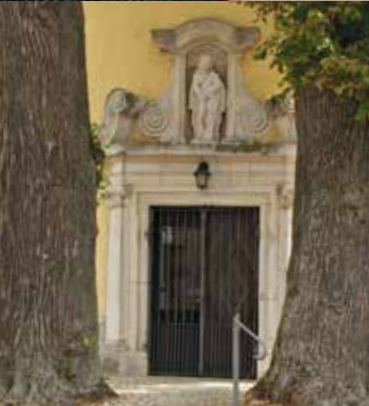
Saal a.d.Donau und seine Ortsteile haben viele Sehenswürdigkeiten zu bieten: z. B. die Andreaskirche in Untersaal (oben und links), die Pestkapelle (unten) und das Rathaus in Saal (ganz unten vor der Renovierung).