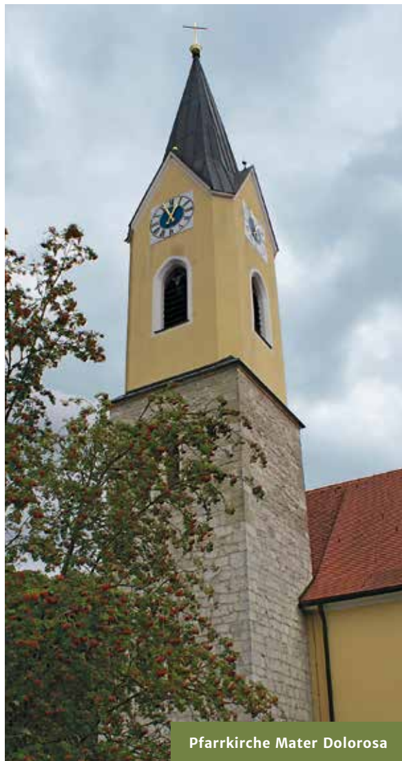
Pfarrkirche Mater Dolorosa