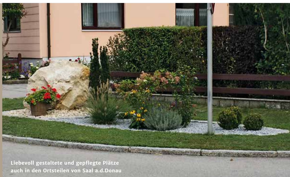
Liebevoll gestaltete und gepflegte Plätze auch in den Ortsteilen von Saal a.d. Donau

hofen als „Poohofen“ erstmals urkundlich erwähnt. Im Jahre 865 tritt es dann bereits als „Hof im Buchenwald“ in den Urkunden auf. Die Kirche St. Mauritius hat wie der Ort Buchhofen selbst eine lange Vergangenheit und wurde immer wieder um- bzw. angebaut. So sind im Baustil der Kirche Züge der Romanik, der Gotik, des Barock und des Rokoko erkennbar.